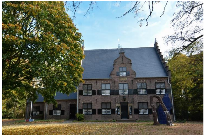
Museum De Wieger

Het stadje Deurne heeft een gezellige kern en is rijk aan kunstwerken, monumenten en andere objecten die in de openbare ruimte een functie hebben, deze aankleden en een gezicht geven, zoals Aquarius , Force , en Verleden Veen . Mocht u toch behoefte hebben aan een weidsere blik dan is Eindhoven een interessante stad om te verkennen. Kortom een