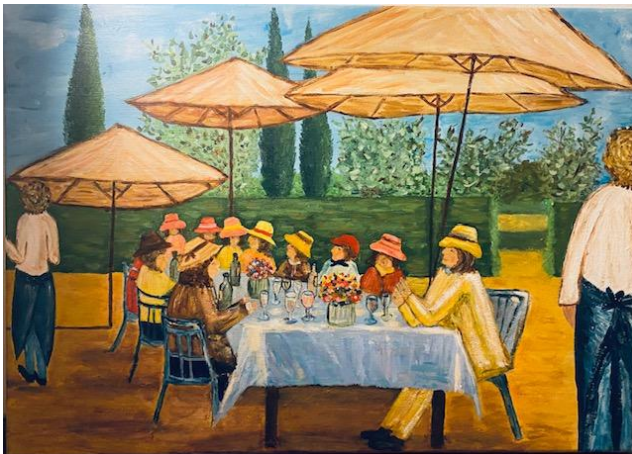
Het terras – Annemiek Sleddering